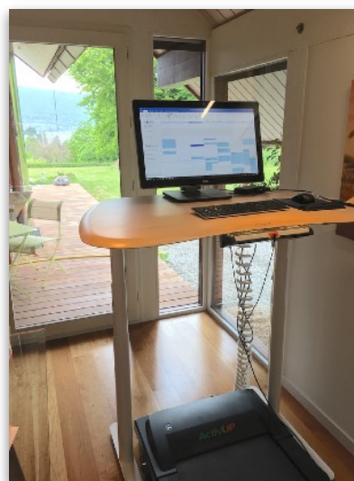
Walking Desks à domicile, modèle 1m20 avec vue