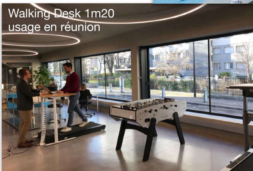
Walking Desk 1m20 usage en réunion

Découvrez les offres de ActivUP http://activup.net/offres-lbbptm