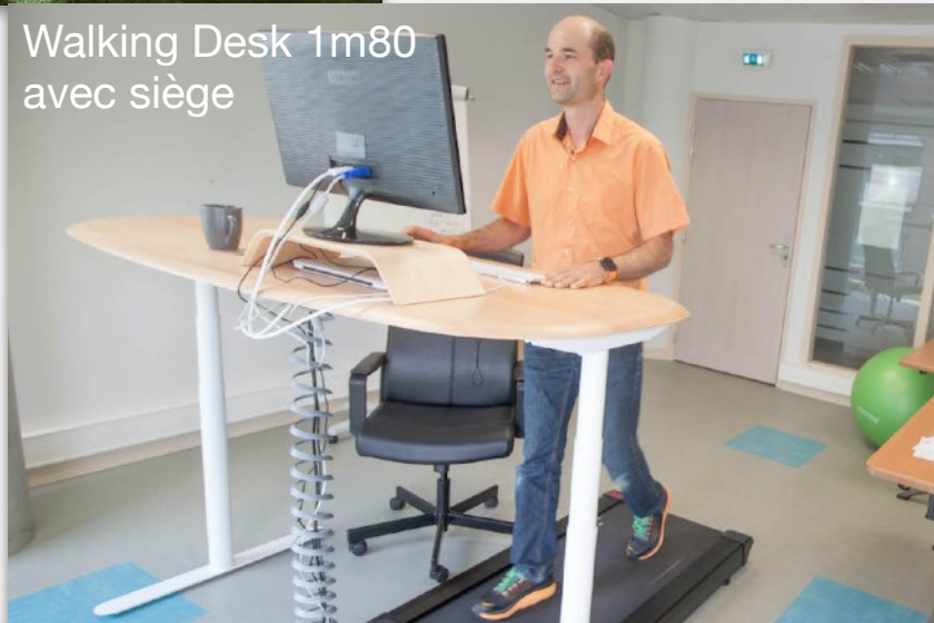
Walking Desk 1m80 avec siège