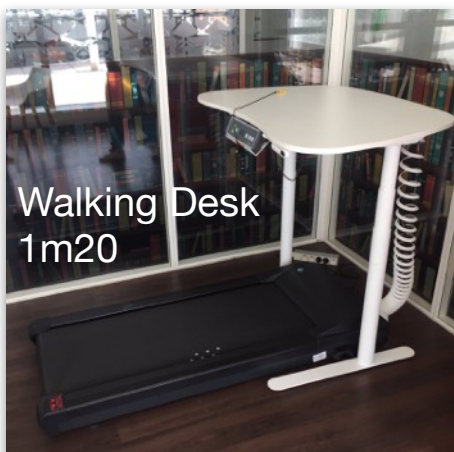
Walking Desk 1m20