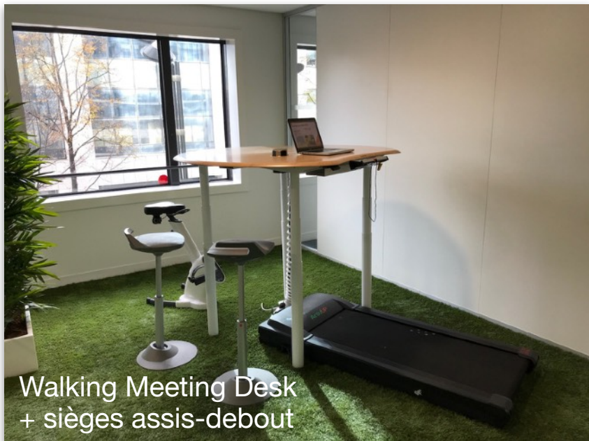
Walking Meeting Desk + sièges assis-debout