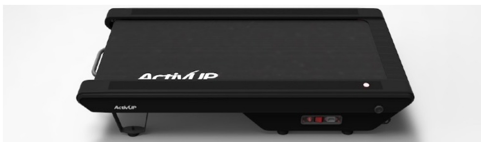
Modèle AU200UD-Solo (Modèle seul sans bureau)