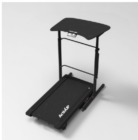
Modèle AU200ED-Noir090 (Bois mélaminé noir, 90x50)