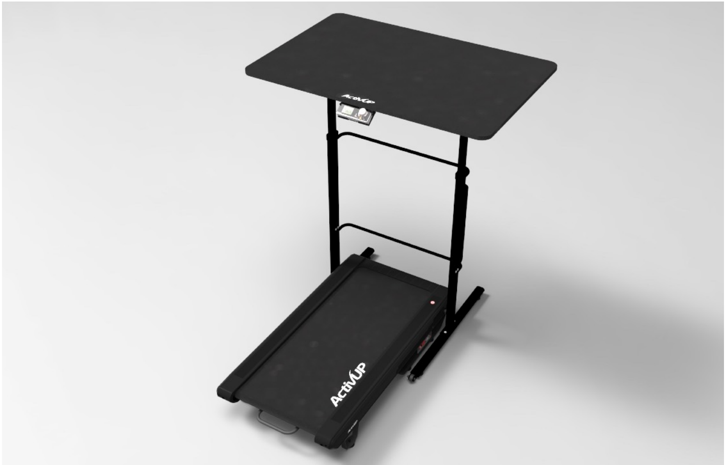
Modèle AU200ED-Noir120 (Bois mélaminé noir, 120x80)

Chez ActivUP, nous sommes des adeptes absolus de la marche au travail. Mettre son corps en mouvement permet de travailler en plus grande forme.