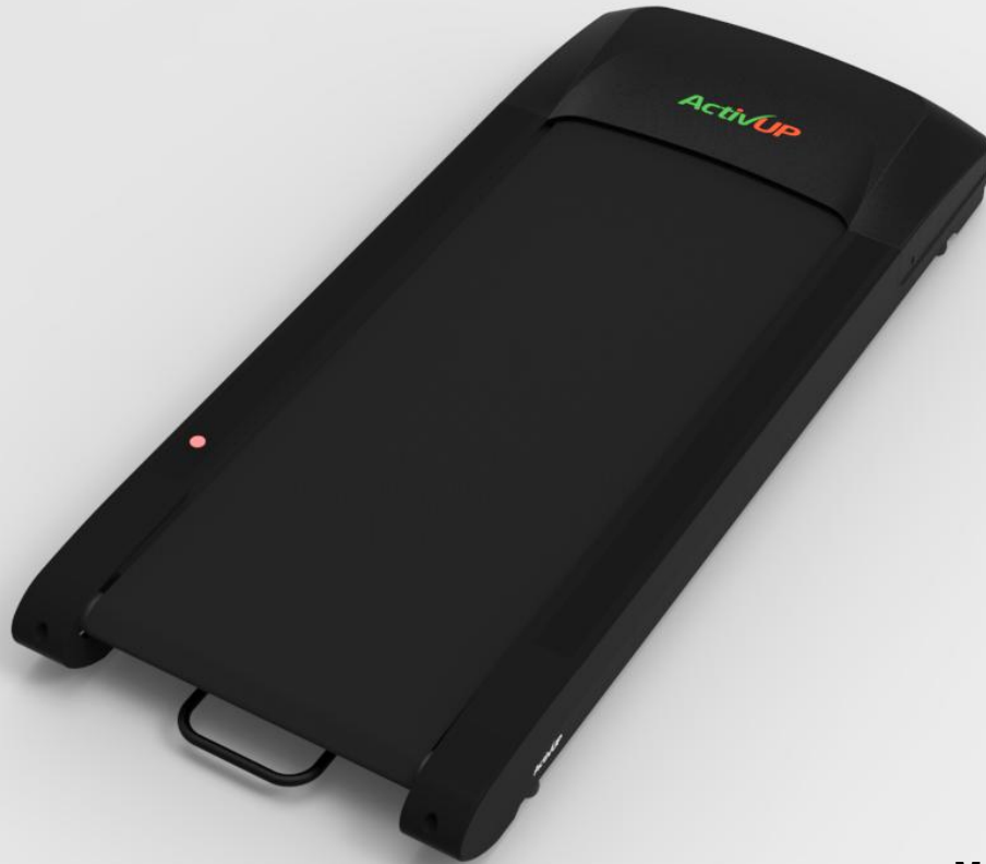
Modèle Softwalk Solo

Silencieux pour vos oreilles, doux pour vos pieds